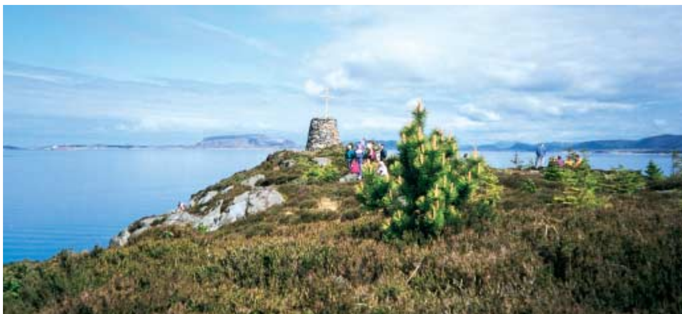
Vardetangen, Norges vestligste fastlandspunkt.